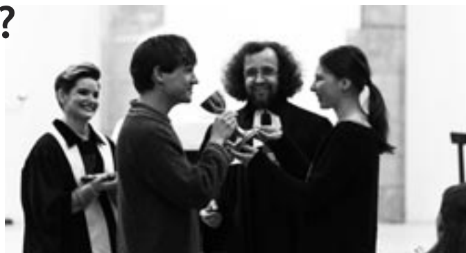
Z bohoslužby pro páry u Martina ve Zdi konané v rámci Mezinárodních dnů proti rasismu.

Na schodech před kostelem se mezitím shromáždila demonstrace. Velitel hasičů káže nenávist a strach z arabských migrantů. „Vždyť nás tu zabijí. Jako ten v dodávce.“ Mezitím ve zповědnici sedí místní opilec a svěřuje se knězi, že to byl on, kdo opilý řídil dodávku a potom z ní rychle utekl. Zvenku přitom zní dobře zivený strach