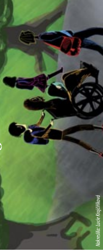
Nakreslila: Lucie Krajčířiková

Když jsem byla malá, nebylo možné běžné se potkat s vozíčkářem nebo třeba člověkem s mentální poruchou. Všichni takoví lidé byli zavíráni do ústavů, protože tehdejší úřady se domnívaly, že to tak bude pro ostatní lepší. Takže dodnes mnozí z nás pořádně nevědí, jak se v přítomnosti takového člověka chovat.